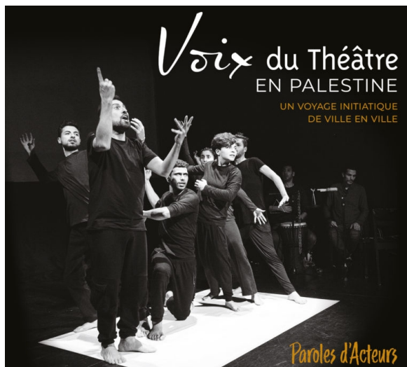
Un autre regard sur la Palestine

Les images dramatiques et violentes venues de Palestine occupent souvent tout l'espace. Bien que florissante, la culture palestinienne est peu connue. Le théâtre en est une composante incontournable qui joue à travers tout le pays le même rôle essentiel qu'ailleurs dans le monde : véhicule de valeurs et idéaux traditionnels et forum où se développent de nouvelles idées et où se tissent des relations humaines.